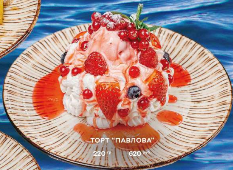
ТОРТ "ПАВЛОВА" 220 гр. 620 руб.