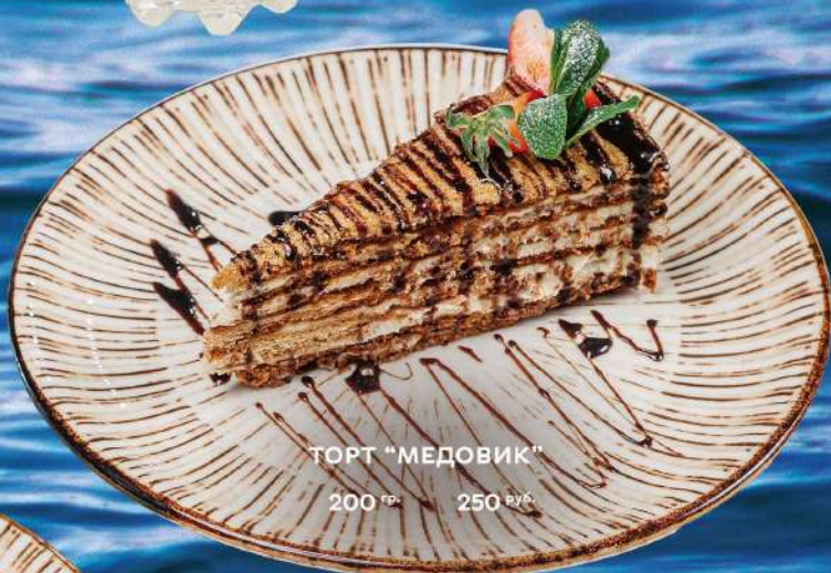
ТОРТ "МЕДОВИК" 200 гр. 250 руб.