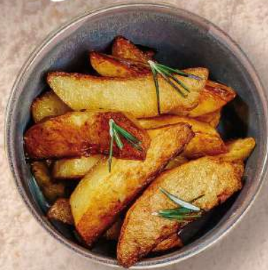
КАРТОФЕЛЬ ЖАРЕНЫЙ 200 гр. 150 руб.