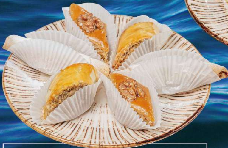
КЯТА 160 гр. 160 руб. ПАХЛАВА 140 гр. 210 руб. МУТАКИ 80 гр. 160 руб.