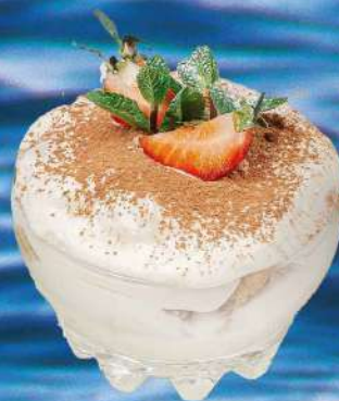
ТИРАМИСУ 180 гр. 450 руб.