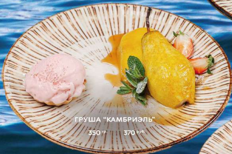
ГРУША "КАМБРИЭЛЬ" 350 гр. 370 руб.