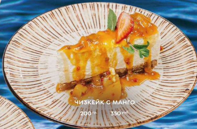
ЧИЗКЕЙК С МАНГО 200 гр. 350 руб.