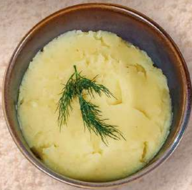
КАРТОФЕЛЬНОЕ ПЮРЕ 150 гр. 140 руб.