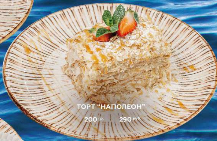
ТОРТ "НАПОЛЕОН" 200 гр. 290 руб.