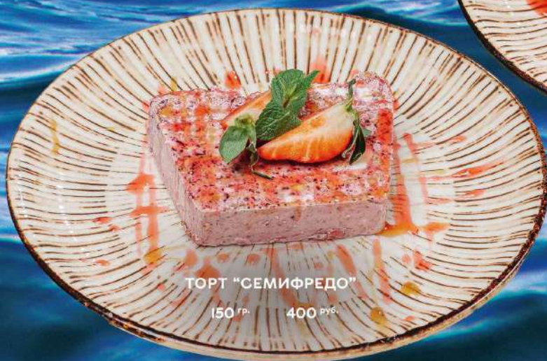
ТОРТ "СЕМИФРЕДО" 150 гр. 400 руб.