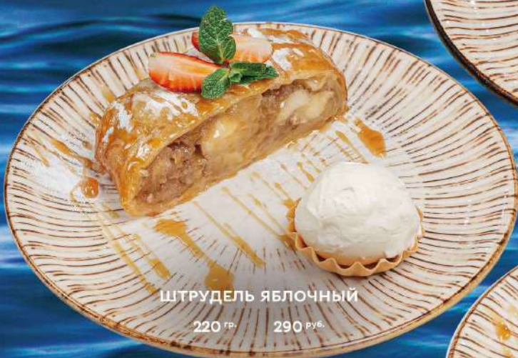
ШТРУДЕЛЬ ЯБЛОЧНЫЙ 220 гр. 290 руб.