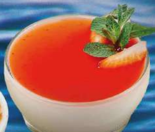
ПАННА-КОТТА 200 гр. 460 руб.