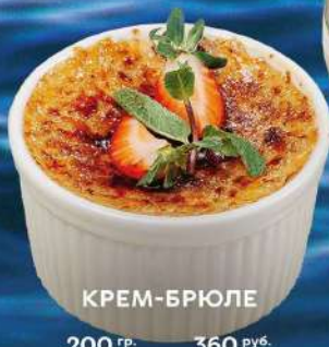
КРЕМ-БРЮЛЕ 200 гр. 360 руб.