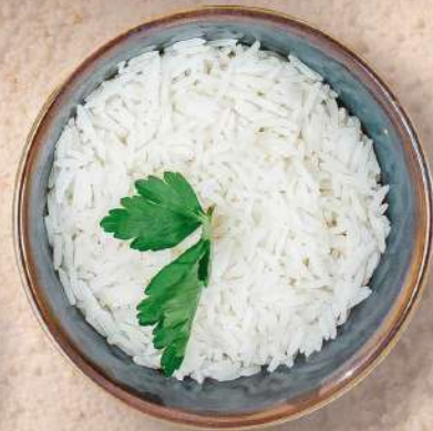
РИС ОТВАРНОЙ 150 гр. 120 руб.