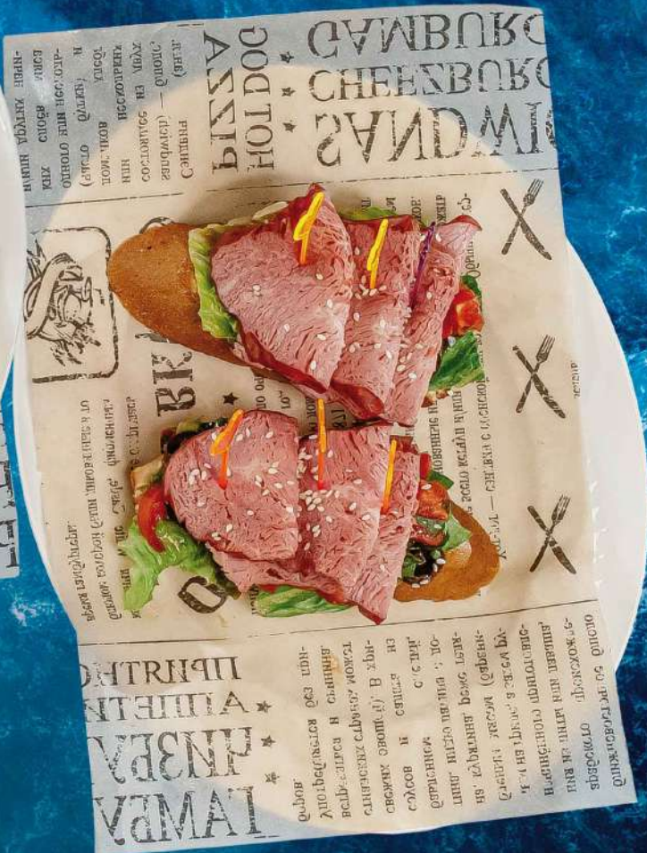
БРУСКЕТТА А-ЛЯ ТОСКАНА багет, копченая говядина, айсберг, оливковый тапенад