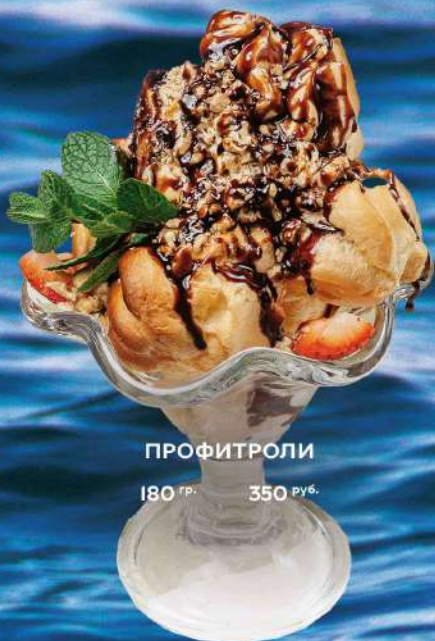
ПРОФИТРОЛИ 180 гр. 350 руб.