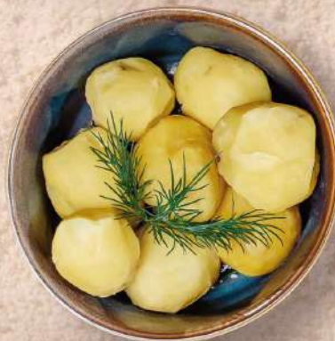
КАРТОФЕЛЬ ОТВАРНОЙ 150 гр. 120 руб.