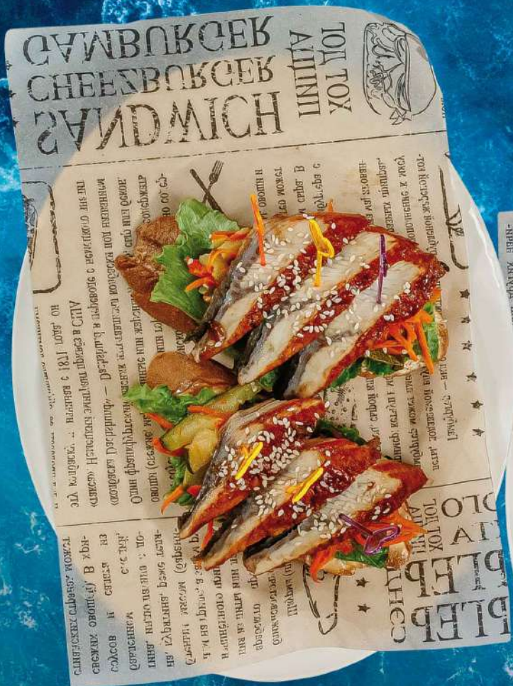
БРУСКЕТТА УНАГИ С СОУСОМ СПАЙСИ багет, копченый угорь, соус "спайси", айсберг, морковь, болгарский перец, цукини